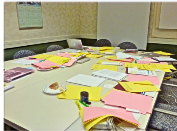
Négociations : 7 mai 2013 Le champ de bataille !